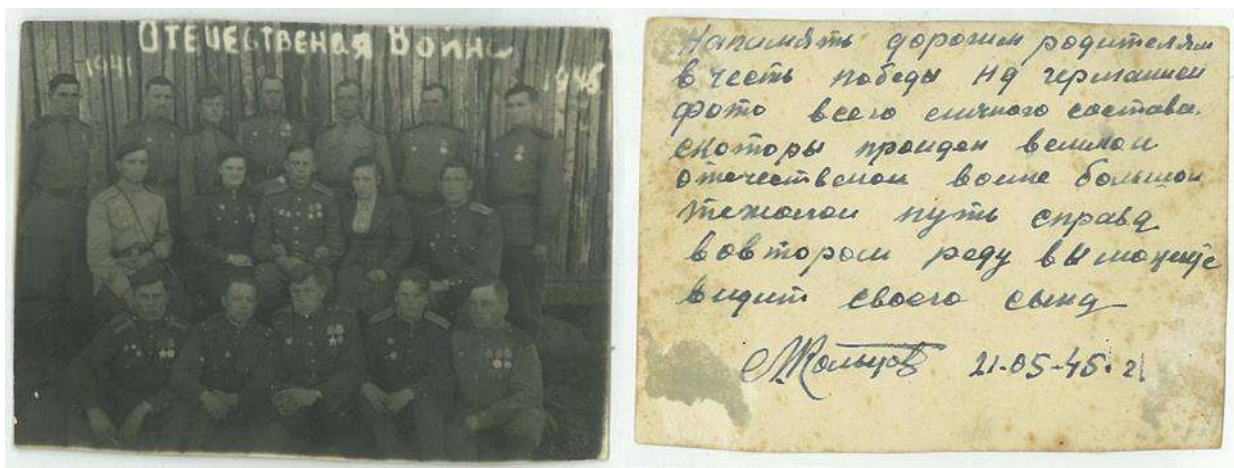
Фотография, отправленная домой с фронта в мае 1945 года и надпись на обратной её стороне

Войну дедушка окончил старшим лейтенантом. Имеет несколько наград: орден Отечественной войны II степени, I степени, орден Красной Звезды, орден Александра Невского, медаль «За победу над Германией в Великой Отечественной войне 1941-1945 г.г.» Но на память о войне остались не только боевые награды. За всю войну дедушка получил 4 серьёзных ранения и несколько контузий.